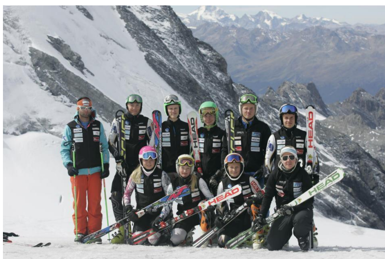
Kuva 1 Alppikoulun huippulinjan oppilaat harjoitusleirillä

Alppikoulun huippu-urheilulinja on opiskellut oppilaita ensimmäisen kerran vuosina 1999-2004 sekä uudelleen vuodesta 2011 lähtien. Valmennusryhmään kuuluu kaudella 2012-2013 kahdeksan urheilijaa, jotka kaikki edustavat ikäkautensa huippuja Suomessa. Tavoitteena on, että jatkossa saadaan uusia opiskelijoita huippu-urheilulinjalle vuosittain.